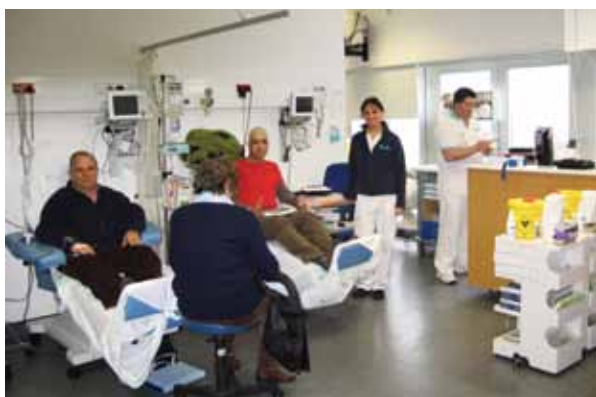
Hospital de Dia de Oncologia

Além das consultas externas programadas são efectuadas diariamente consultas de urgência aos doentes da Unidade no horário de funcionamento do Hospital de Dia, dada a especificidade desta patologia e do seu tratamento. Realizam-se semanalmente Consultas de Decisão Terapêutica (CDT) que visam o estabelecimento da estratégia terapêutica integrada e planeada para todas as neoplasias (abordagem multidisciplinar). Funcionam nos quatro hospitais, onde se desenvolve a actividade oncológica do CHLO. Actualmente existem CDT's de mama, cabeça e pescoço, cirurgia e patologia hepato – biliar, urologia e ginecologia dispersas pelos quatro hospitais.