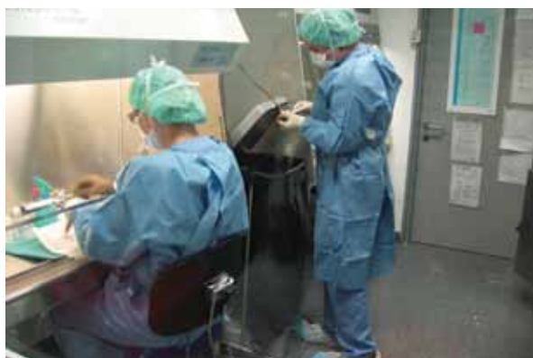
Câmara de Fluxo Laminar