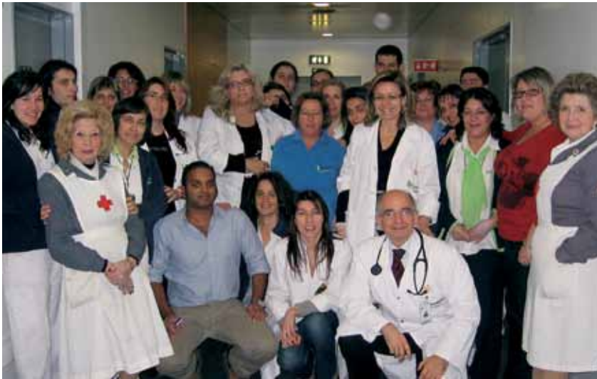
Equipa da Unidade de Oncologia

A equipa de enfermagem do Hospital de Dia de Oncologia é composta por onze enfermeiros, dos quais grande parte são jovens. Para alguns deles, esta constituiu mesmo a primeira experiência profissional.